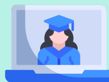
Apprendre (lire, chanter, compter...)