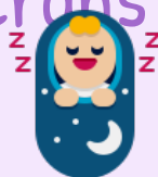
Un meilleur sommeil pour bébé

Une meilleure motricité et acquisition du langage