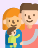
Un plus fort lien d'attachement