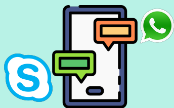
Communiquer avec sa famille